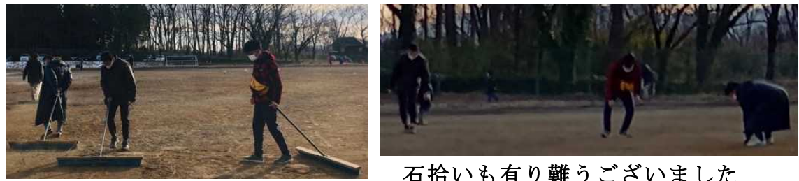
石拾いもあり難うございました 2日間のトンボかけお疲れ様でした。本部運営補助。お弁当や飲み物の世話、お家のみなさんの支援に感謝です。有り難うございました。