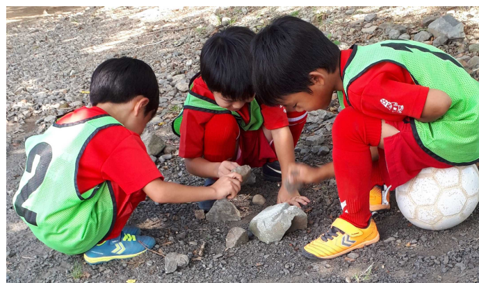
化石が出るかなと言っていました。 ハチオウジサウルスはいるか？