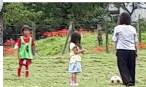
試合の合間にお家の人と練習！！ 努力は実ります！！