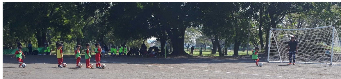
試合前のドリブルシュート 清水コーチと子ども達