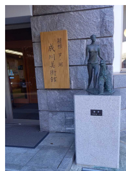
箱根 芦ノ湖 成川美術館