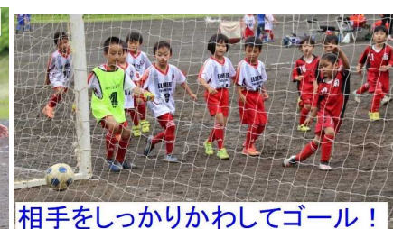
相手をしっかりかわしてゴール！