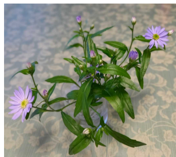
a forget me not 忘れな草