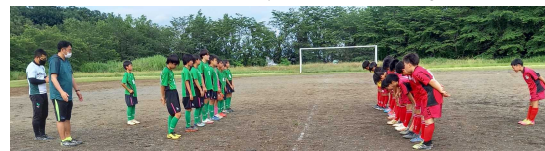
最後にエールの交換